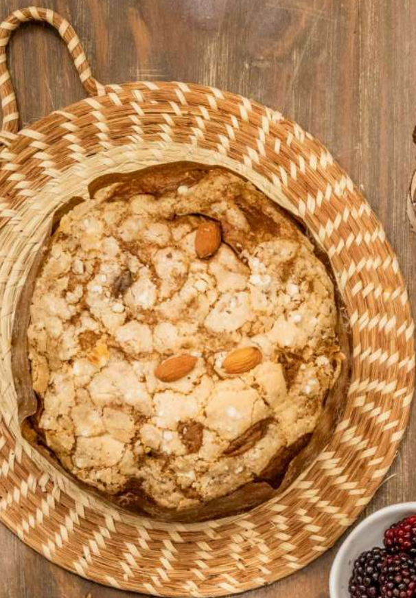
Pavé de praliné y chocolate 120 mil