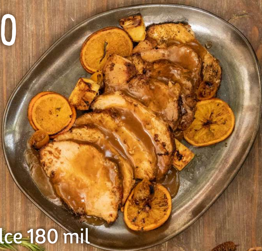
Cerdo con salsa agridulce 180 mil