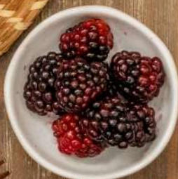
Chesse cake 120 mil con frutos rojos.